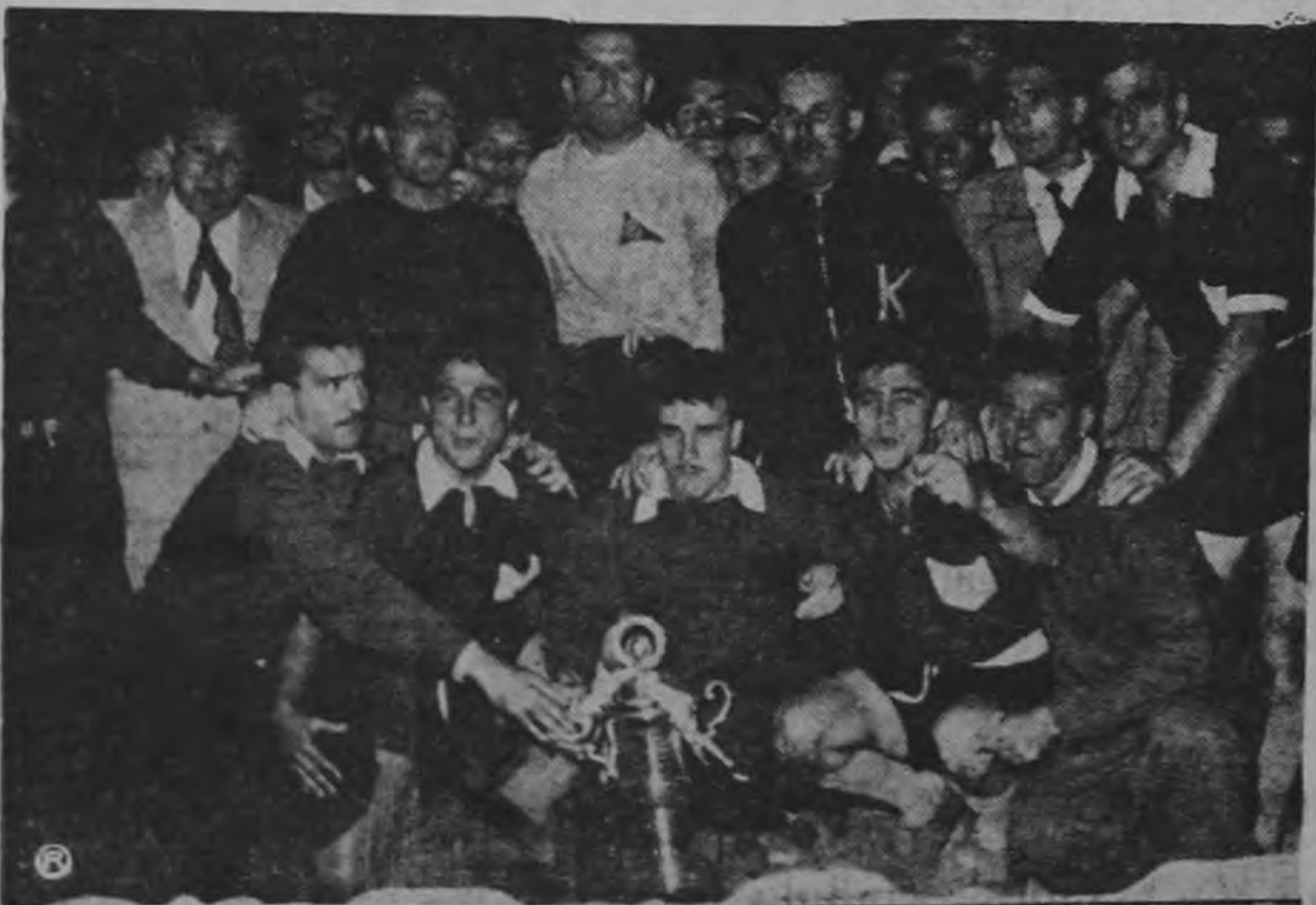
Los muchachos de Lanús recogieron el trofeo de la Asociación de Periodistas de Costa Rica después de su brillante e indiscutible triunfo sobre el Saprissa, Campeón de Costa Rica, por dos a cero. Celebraron así victoriosamente su coronación en un partido que ganaron tres partidos y perdiendo sólo en su debut. Pocos equipos argu...