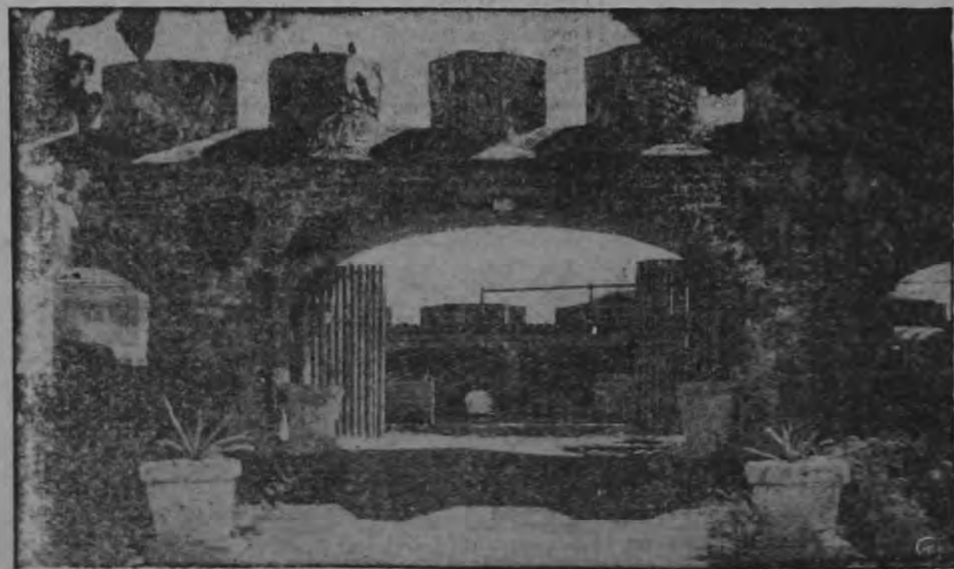
Fort Charles... el fuerte que otro tiempo cuidaba la ciudad y Puerto Royal —Port-Royal —fue en un tiempo residencia del Pirata Henry Morgan.