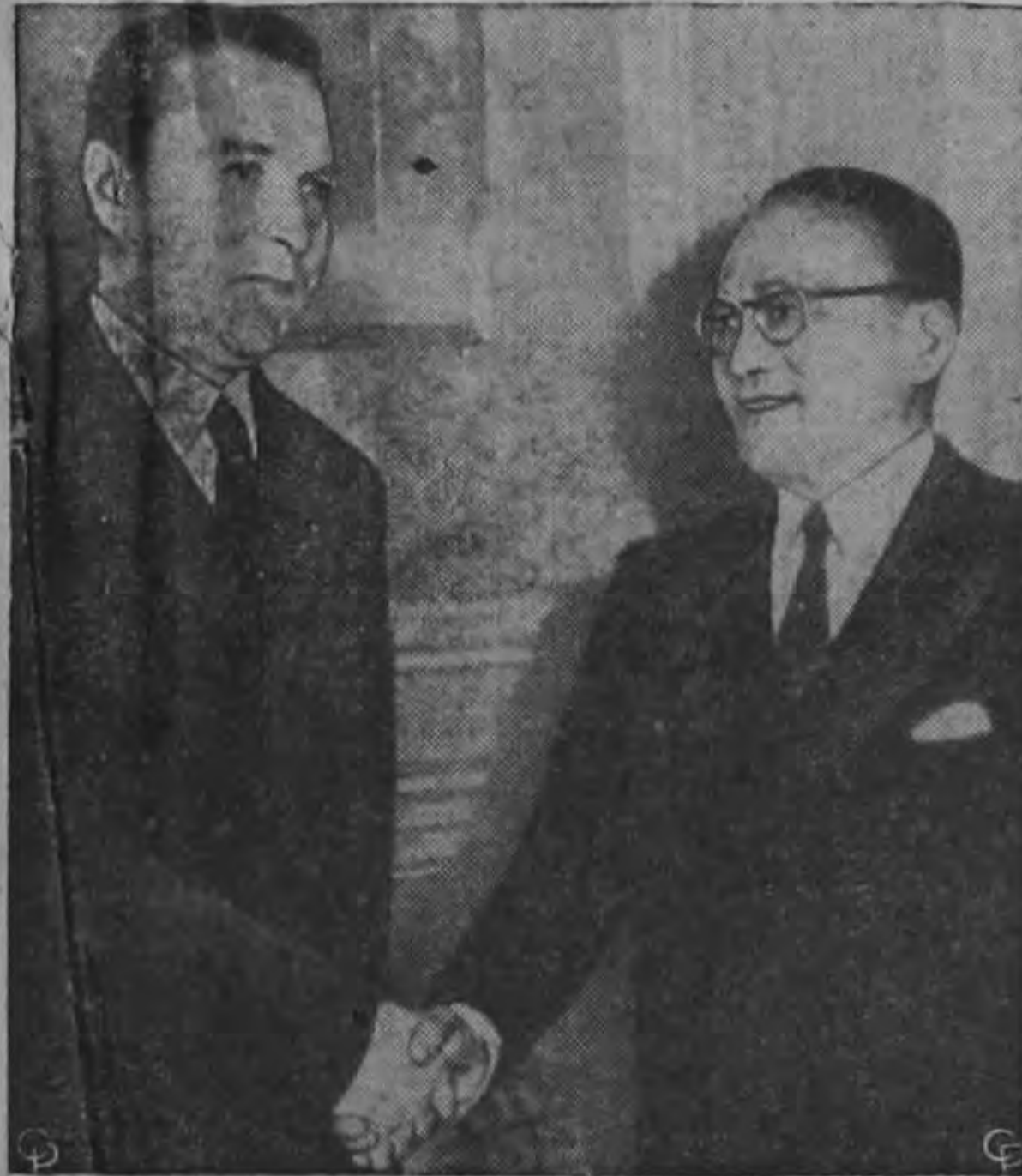
El Embajador soviético Jacob Malik (izquierda) y Shunichi Matsumoto, del Japón, se estrechan la mano al reanudar las negociaciones de un tratado de paz en la Embajada japonesa en Londres. Las negociaciones anteriores se suspendieron hace cuatro meses.

REANUDAN NEGOCIACIONES PARA TRATADO DE PAZ